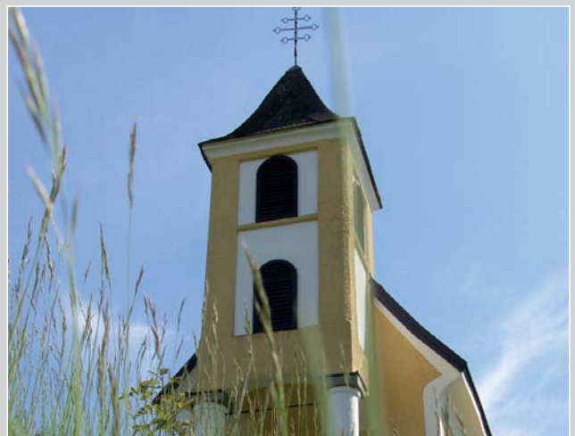
Die fromme Pause ...

Skringer Weine werden nie langweilig. Ihr Spiel von Frucht und Säure wirkt so brilliant und sauber wie die blitzblanken Edelstahl tanks im Keller.