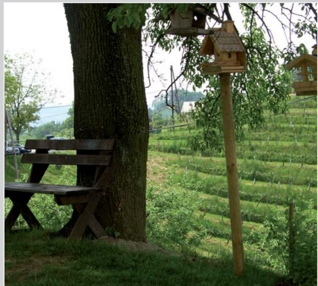
Die gemütliche Rast ...